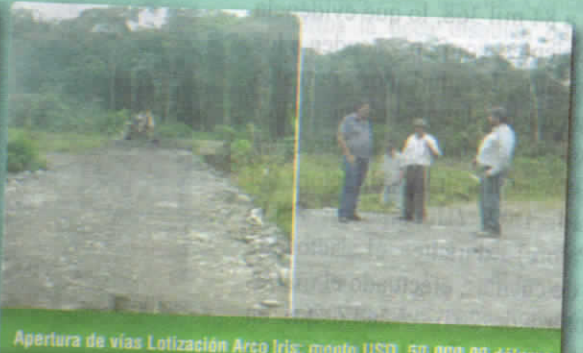
Apertura de vías Lotización Arco Iris; monto USD. 50.000,00 dólares