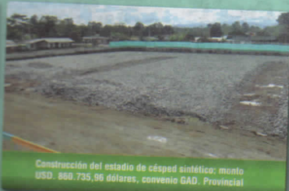
Construcción del estadio de césped sintético; monto USD. 860.735,96 dólares, convenio GAD. Provincial