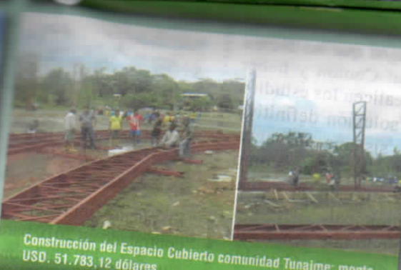
Construcción del Espacio Cubierto comunidad Tunaime; monto USD. 51.783,12 dólares