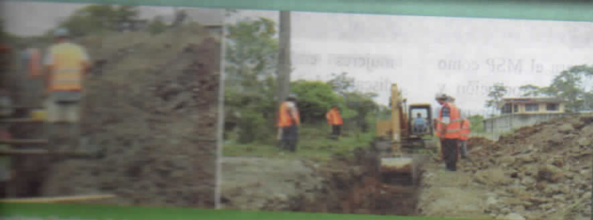
Obra de mejoramiento de las calzadas Pablo Naranjo (barrio Libertad), Las arquídeas (barrio 22 de Junio) y Barrio Nuevo; monto USD. 220.000,00 dólares