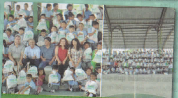
Entrega de Kits Escolares; monto USD. 30.000,00 dólares