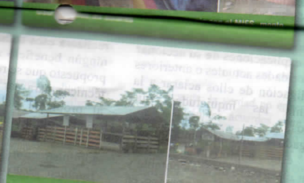
Adecuación y cerramiento del Camal Municipal; monto USD. 15.000,00 dólares