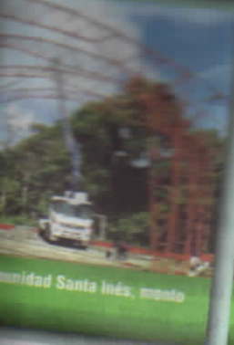
Comunidad Santa Inés; monto